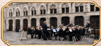
Brassband Blaast de Bazuin Oude- en Nieuwebilddijk