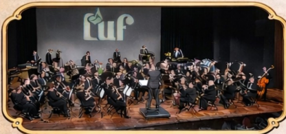
Harmonie L'Union Fraternelle Zeelst - Veldhoven